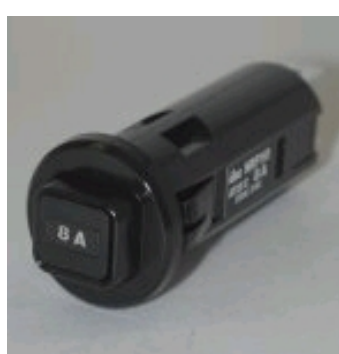
NRF -110 -5A