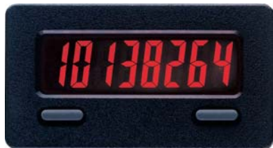
CUB 7T in Originalgröße

Der CUB 7T erfasst die Betriebszeit von Maschinen und Anlagen. Die Ansteuerung erfolgt je nach Ausführung über einen Schaltkontakt oder eine angelegte Spannung. Ist der Zähler aktiv, blinkt ein Indikator in der Anzeige. Der CUB 7T verfügt über 10 verschiedene Zeitbereiche, die über die Fronttasten eingestellt werden. Eine Rückstellung ist über die Fronttaste und einen externen Eingang möglich.